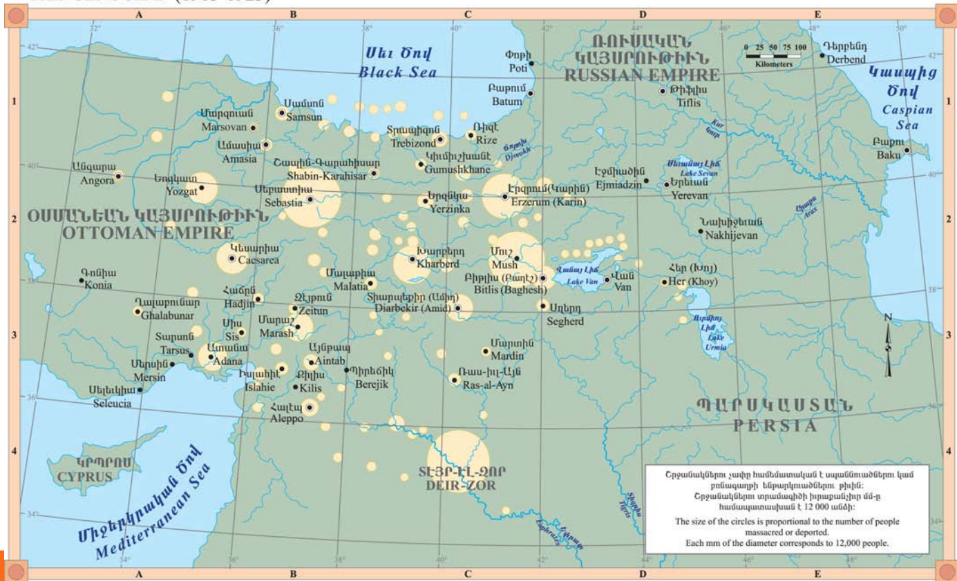
ՄԵԾ ԵՂԵՌՆԸ (1915-1923) THE GENOCIDE (1915-1923)